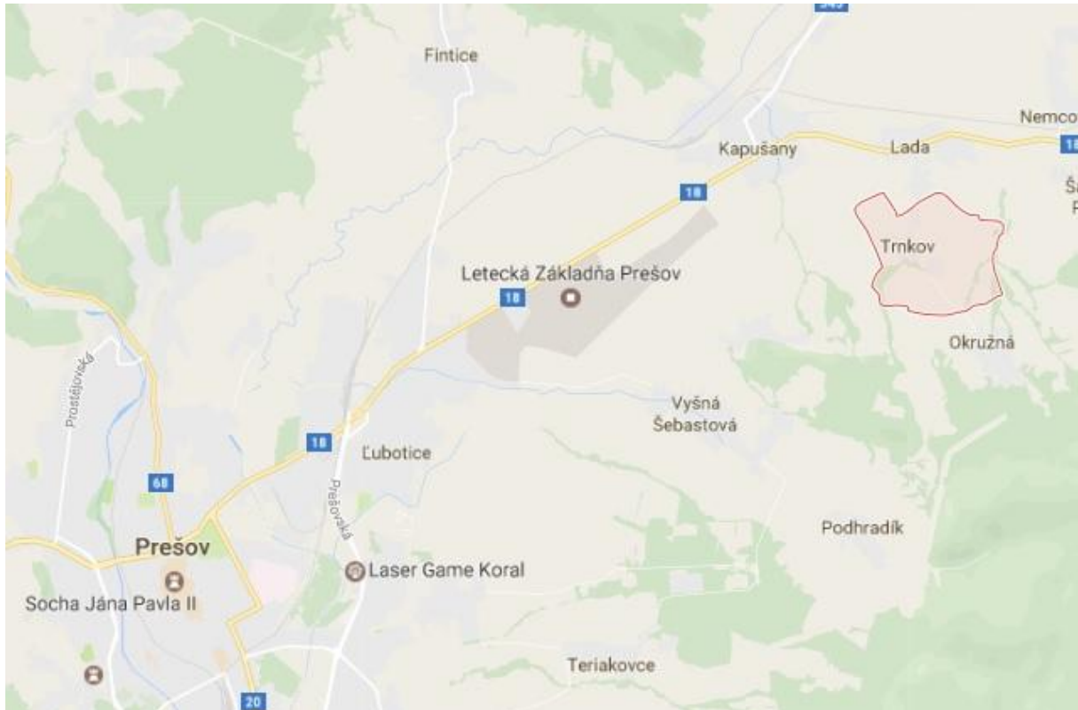
Obr. 1 Poloha obce Trnkov v rámci Prešovského samosprávneho kraja

Obec Trnkov sa nachádza približne 14 kilometrov východne od mesta Prešov a susedí s tromi obcami – Ladou, Kapušanmi a Okružnou. Nadmorská výška obce sa pohybuje v rozmedzí od 280 m n. m. do 377 m n. m., pričom stred obce sa nachádza vo výške 305 m n. m.. Obec sa nachádza na severnom okraji Košickej kotliny v podcelku Toryská pahorkatina. Intravilán obce leží v hlbokom záreze malého údolia, ktoré vymodeloval Trnkovský potok pritekajúci od Maglovca.